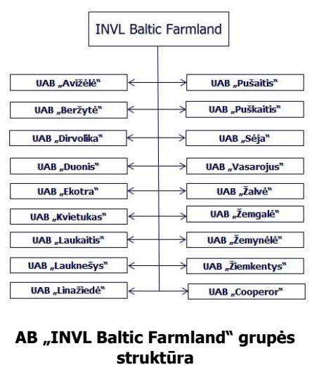
AB „INVL Baltic Farmland“ grupės struktūra

Bendrovė nuo 2014 m. birželio 4 d. yra listinguojama NASDAQ Vilnius Papildomame sąrašė.