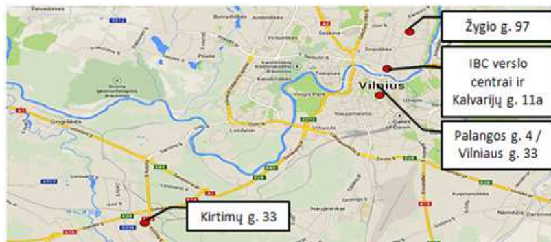
AB „INVL Baltic Real Estate“ įmonių grupės nekilnojamojo turto objektai Vilniuje