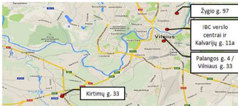
AB „INVL Baltic Real Estate“ įmonių grupės nekilnojamojo turto objektai Vilniuje