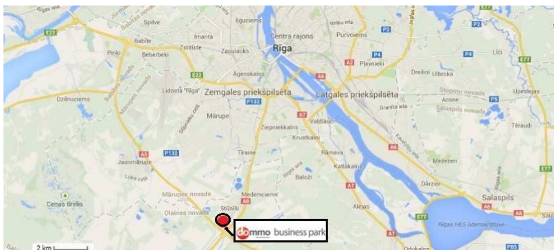
AB „INVL Baltic Real Estate“ įmonių grupės nekilnojamojo turto objektai Rygoje