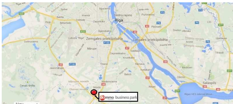
AB „INVL Baltic Real Estate“ įmonių grupės nekilnojamojo turto objektai Rygoje