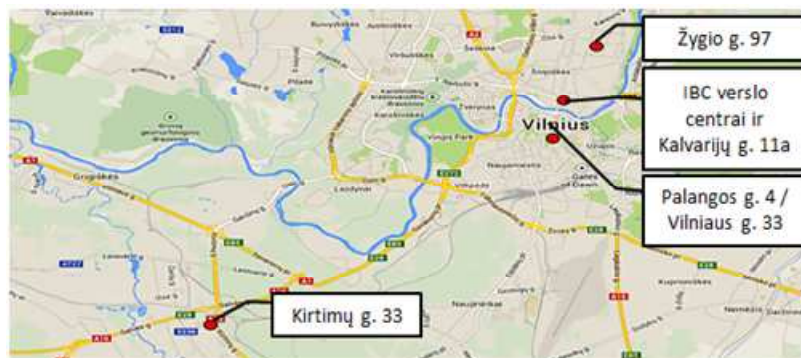
AB „INVL Baltic Real Estate“ įmonių grupės nekilnojamojo turto objektai Vilniuje