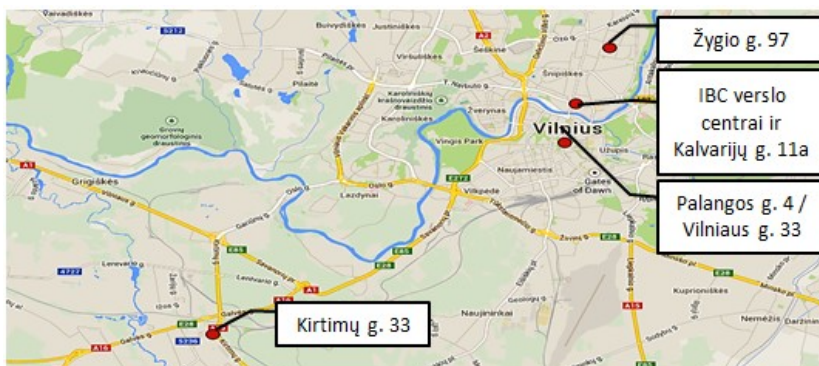
AB „INVL Baltic Real Estate“ įmonių grupės nekilnojamojo turto objektai Vilniuje