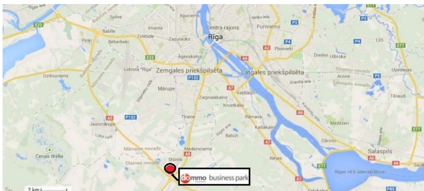
AB „INVL Baltic Real Estate“ įmonių grupės nekilnojamojo turto objektai Rygoje